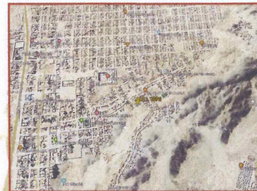
Zona de la ejecución del Proyecto

Para llegar a la zona del proyecto tomando como referencia la ciudad de Lima se tiene que hacer el siguiente recorrido: