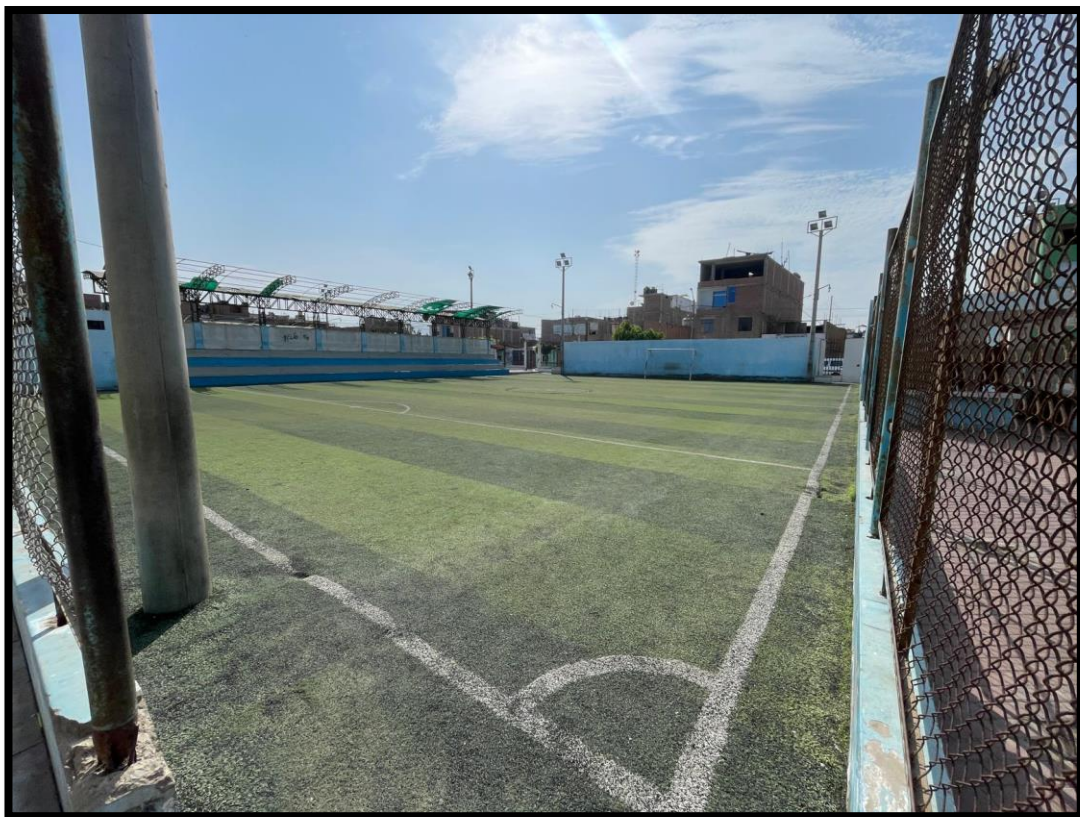
Figura N° 5: Vista de la Cancha en Mal Estado

Actualmente las infraestructuras deportivas se encuentran de regular a mal estado, dado a la falta de mantenimiento del COMPLEJO FUJIMORI , requiere énfasis en la zona de juegos recreativos de niños, Reforzamiento del cerco del campo de fútbol, Rehabilitación de los baños, Pintado de las instalaciones interiores y exteriores y techado con cobertura de TR4 y las instalaciones sanitarias e instalaciones eléctricas.