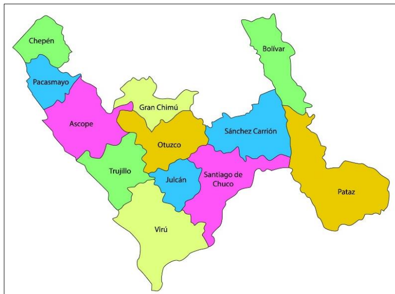
Figura N°01: Ubicación de la provincia de Virú