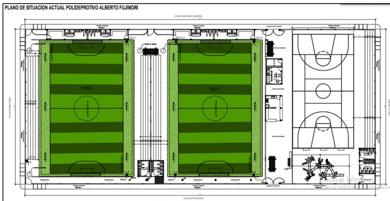
Figura N° 7: Vista del Plano de situación actual

juegos de niños; todas estas acciones con la finalidad de brindar una óptima funcionalidad en la plaza de armas y mejorar el ornamento del distrito de Chao.