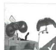
Soportes de piernas ajustables