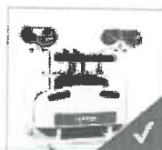
Carro de accesorios