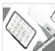
Paneles de control integrados en rieles laterales