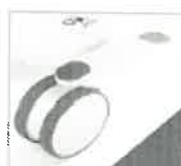
Ruedas gemelas 150mm