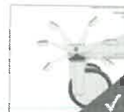
Ruedas con bloqueo central y direccional, 125 mm