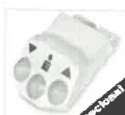
Interruptor de pie