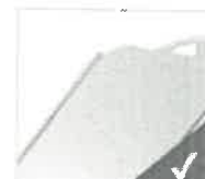
Respaldo HPL translúcido a rayos X