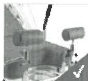
Soportes de talón tapizados