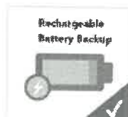
Respaldo de batería recargable