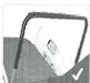
Barra de sentadillas