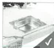
Recipiente para residuos de acero inoxidable