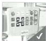
Panel de control de enfermería