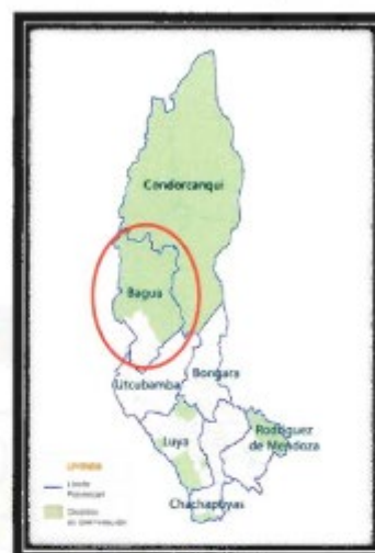
LOCALIZACIÓN GEOGRÁFICA DE LA PROVINCIA DE BAGUA