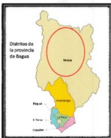
LOCALIZACIÓN GEOGRÁFICA DEL DISTRITO DE IMAZA