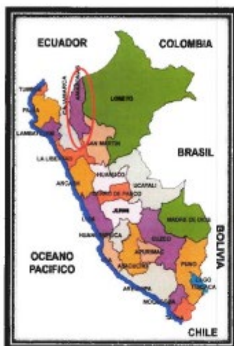
LOCALIZACIÓN GEOGRÁFICA DEL DEPARTAMENTO DE AMAZONAS

"AÑO DE LA RECUPERACION Y CONSOLIDACION DE LA ECONOMÍA PERUANA"