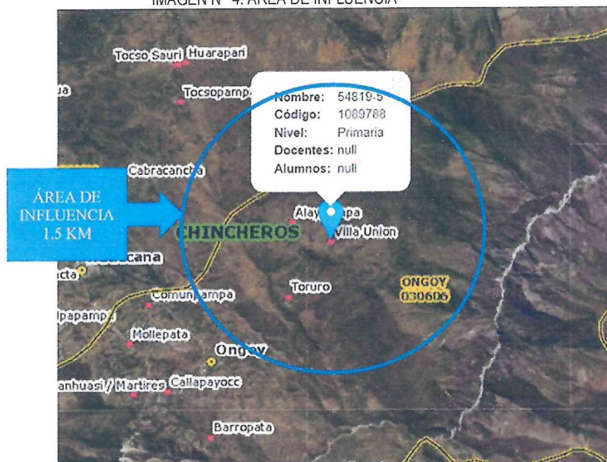
IMAGEN N° 4: ÁREA DE INFLUENCIA