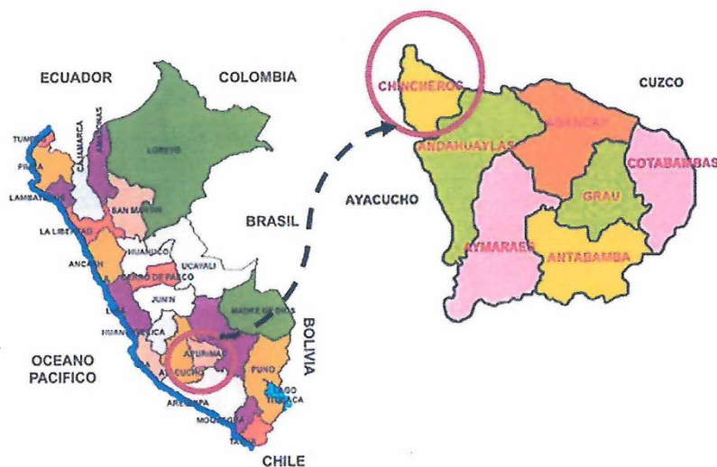
IMAGEN N° 2: UBICACIÓN DISTRITAL Y LOCAL (DISTRITO DE ONGOY)