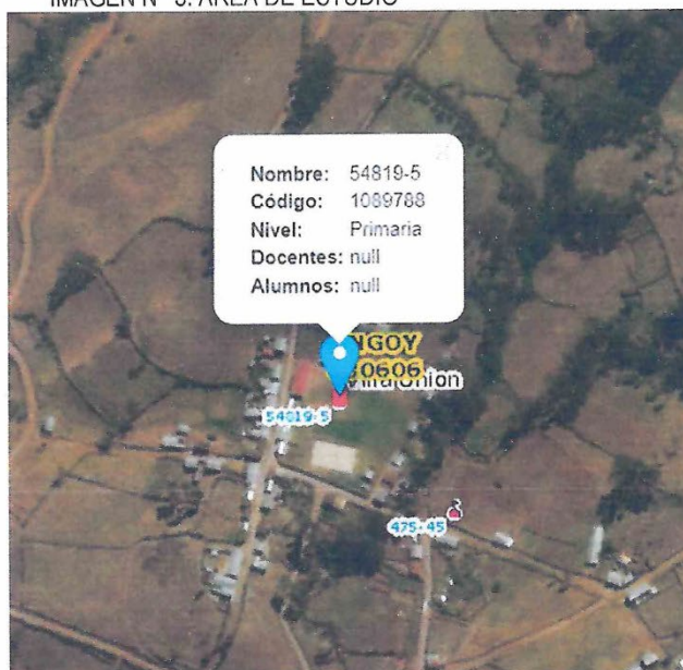
IMAGEN N° 3: ÁREA DE ESTUDIO