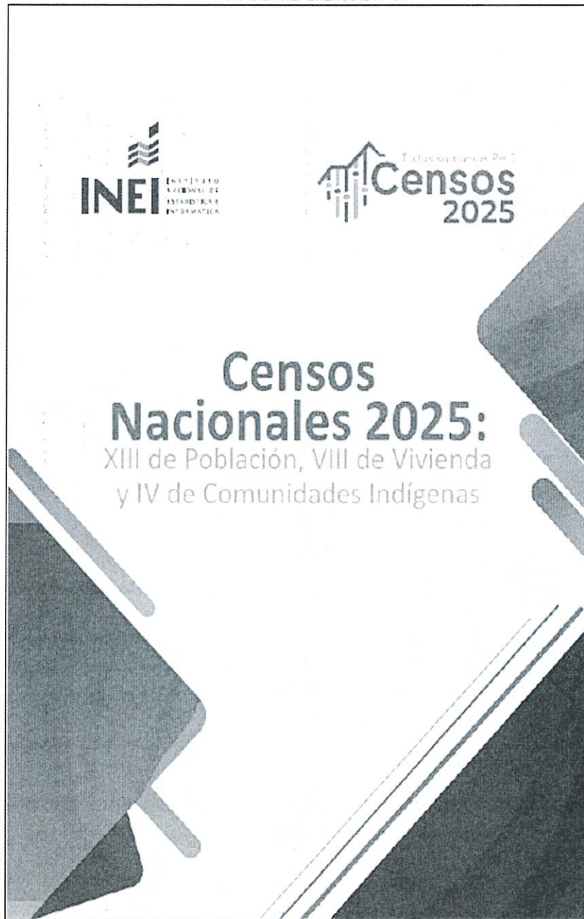
IMAGEN REFERENCIAL N° 01

Instituto Nacional de Estadística e Informática