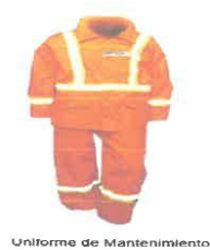
Uniforme de Mantenimiento