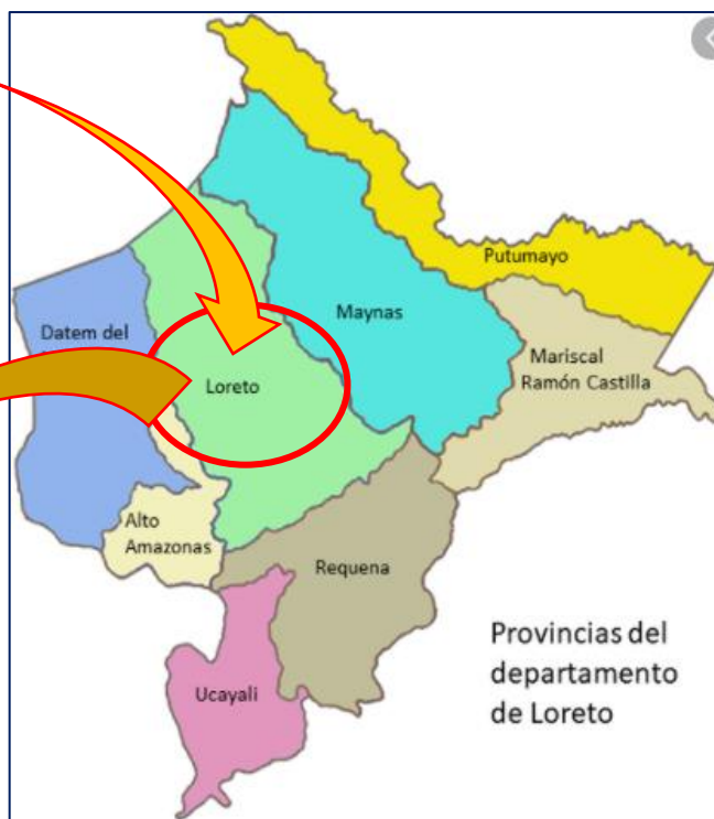
PROVINCIA DE LORETO