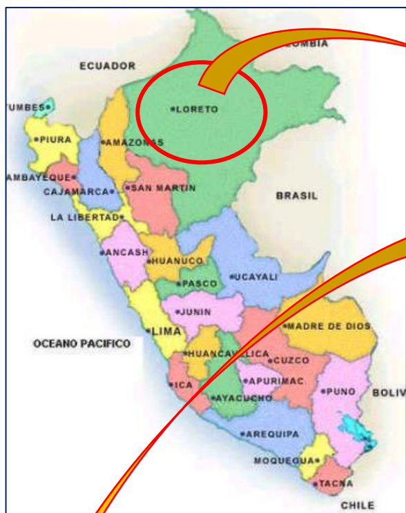
DEPARTAMENTO DE LORETO