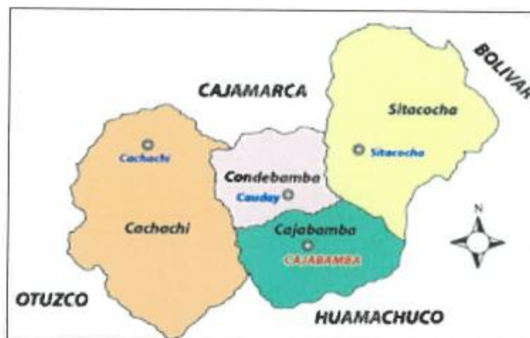
Mapa Distrital de Condebamba – Tangalbamba Alto.