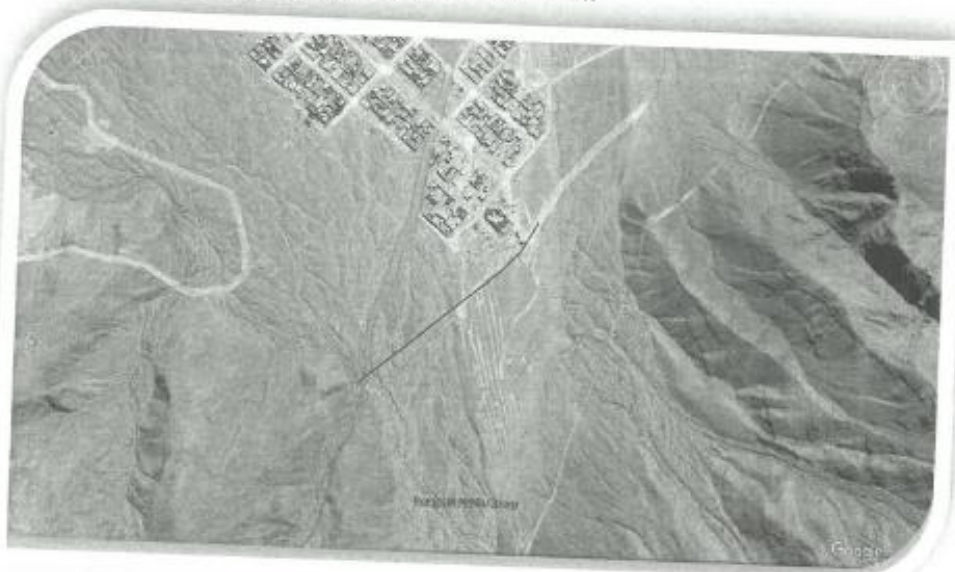
CUADRO N° 3.1 - 1: CUADRO DE LOCALIZACIÓN

El distrito de Vista Alegre es uno de los cinco distritos de la Provincia de Nazca, ubicado en el Departamento de Ica, bajo la administración del Gobierno regional de Ica, en el sur del Perú.