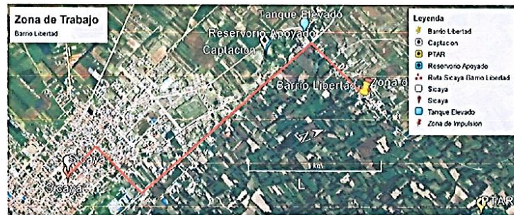
Imagen Satelital de la zona de trabajo (barrio La Libertad)