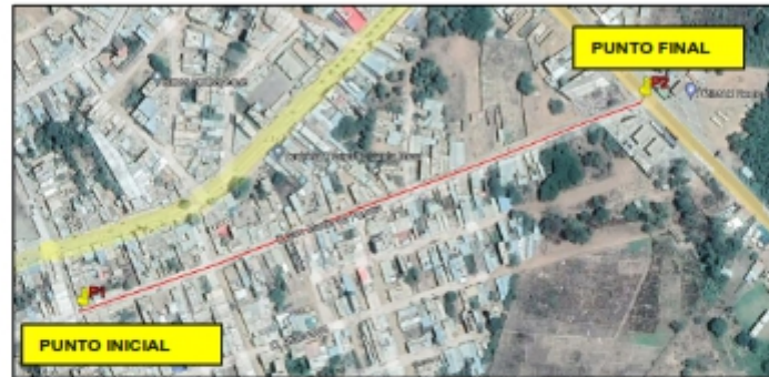
Ilustración N° 01: Localización del Proyecto

MUNICIPALIDAD DISTRICTAL DE OLMOS "Decenio de la igualdad de oportunidad para mujeres y hombres" "Año de la unidad, la paz y el desarrollo"