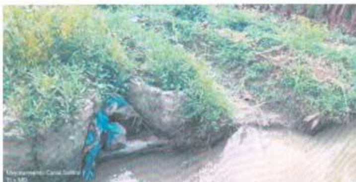
Toma Lateral. Obsérvese la condición desfavorable en que se encuentra la toma.

Las tomas laterales se encuentran en mal estado. Las mayorías son aperturas o cortes a un lado del canal con el fin de captar las aguas de riego. Luego del riego los usuarios proceden a sellar dichas aperturas con material propio.