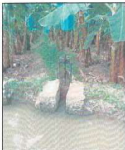
Toma Lateral. Obsérvese la condición desfavorable en que se encuentran ambas tomas.

Se han identificado las siguientes Tomas Laterales: