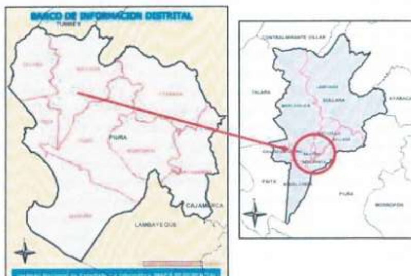
Figura 1. Ubicación geográfica y política