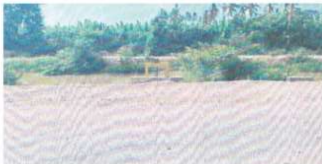
Imagen tomada desde el punto de Toma de captación en el Canal Miguel Checa

Av. 27 de octubre N° 202, Salitral – Sullana – Piura