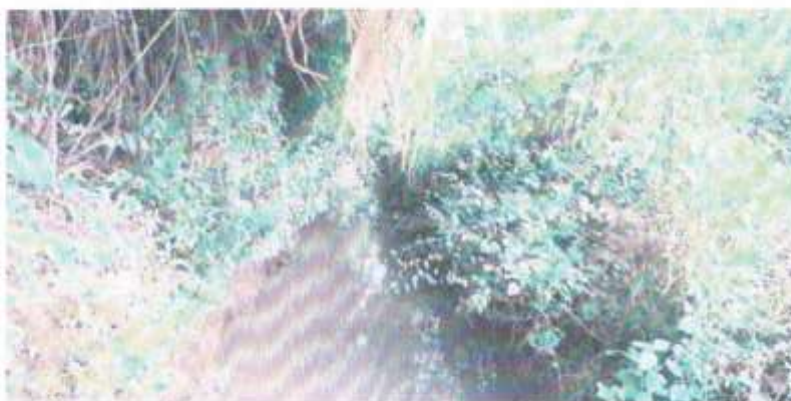
Vista del canal Salitral I. obsérvese la presencia de malezas.

Av. 27 de octubre N°202, Salitral – Sullana – Piura