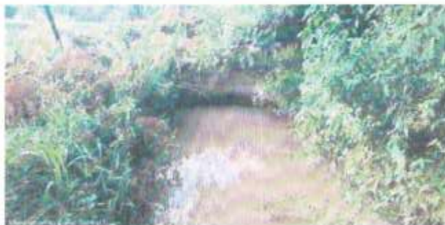
Inicio del tramo de canal considerado

En la actualidad el canal Salitral I, no se encuentra impermeabilizado en toda su longitud, por lo que las pérdidas de agua por infiltración son altas. Agudizan esta situación las labores de limpieza y descolmatación del canal mediante forma mecánica, produciéndose sobre excavaciones. De esta forma las tomas rústicas existentes o en mal estado quedan muy por encima del fondo del canal, por lo que los usuarios acuden a colocar retenciones rústicas a fin de elevar el tirante de agua.