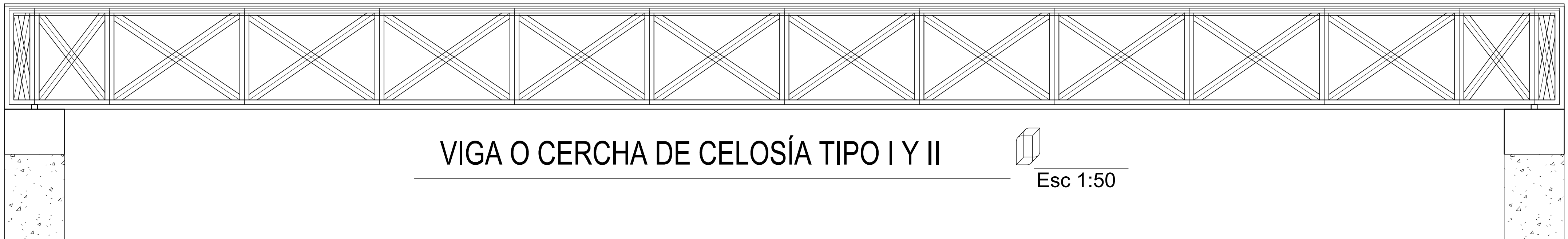
VIGA O CERCHA DE CELOSÍA TIPO I Y II