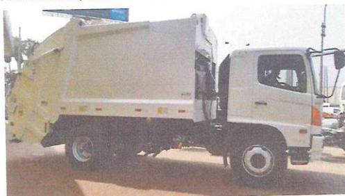
Fig 1. Foto referencial de Camión compactador de 15M3

Las especificaciones técnicas son las mínimas que puedan satisfacer al área usuaria y tienen un carácter general orientado a que, en el proceso de adquisición al menos puedan participar dos o tres marcas de reconocida trayectoria asegurando a la entidad una adquisición confiable y donde los términos de referencia de la misma no lo precisen.