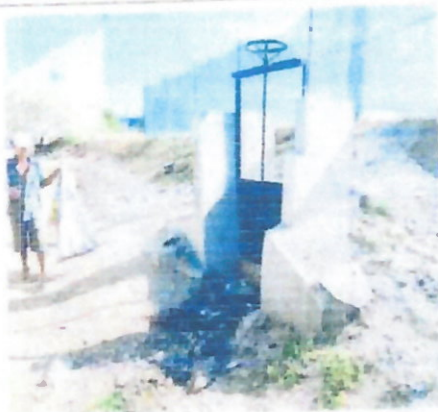
1. PANEL FOTOGRAFICO DE ZONA VULNERABLE

"Año de la Recuperación y Consolidación de la Economía Peruana"