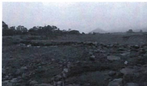
Barraje Deteriorado – Vista desde aguas arriba del barraje. Imagen N° 11: Socavación en la base del Canal de Aducción

"Decenio de la Igualdad de Oportunidades para Mujeres y Hombres (2018-2027)" "Año de la unidad, la paz y el desarrollo"