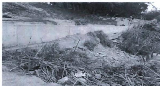
Vista del Margen Izquierda del cauce del río