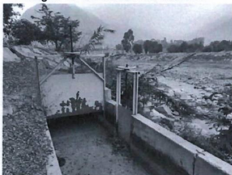
Vista de las compuertas del canal de Aducción.