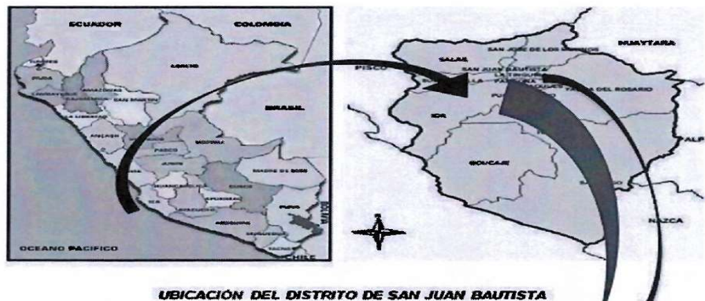
UBICACIÓN DEL DISTRITO DE SAN JUAN BAUTISTA

Localidad: Centro Urbano de San Juan, CP el Limón, CH La Angostura, CP San Martín, sector 1 y 2 Los Patos Distrito: San Juan Bautista Provincia: Ica Departamento: Ica