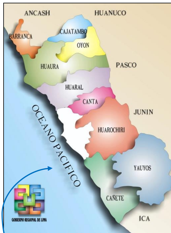
Ubicación provincial (Huaral)