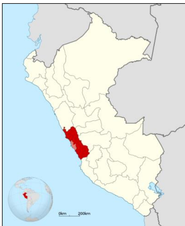
Ubicación departamental (Lima)