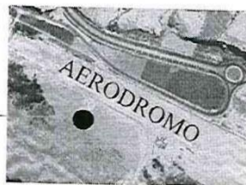
Figura 1 Ubicación del emplazamiento de obra (Punto Negro)

El plazo de entrega del bien será de 30 DÍAS CALENDARIOS según CRONOGRAMA DE ENTREGA a partir de día siguiente de la notificación de la orden de compra.