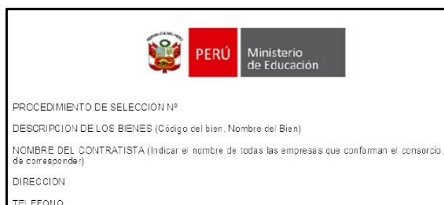
FIGURA N° 02

El logotipo tendrá el siguiente rango de medidas 8cm a 12cm de largo x 4cm a 8cm de alto