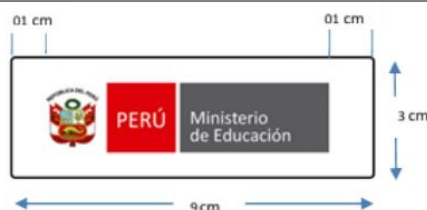
FIGURA N° 01

Medidas: Este logotipo tendrá 9 cm de largo x 3 cm de alto.