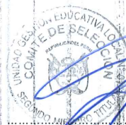
EDGAR NUÑEZ HINOSTROZA TITULAR MIEMBRO 2