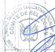
EDGAR NÚÑEZ HINOSTROZA TITULAR MIEMBRO 2