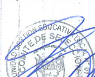
EDGAR NUÑEZ HINOSTROZA TITULAR MIEMBRO 2