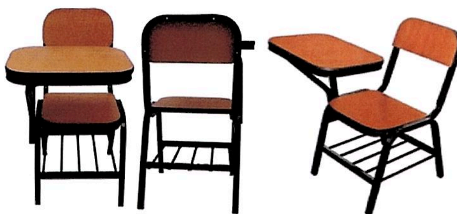
VISTA LATERAL IZQUIERDA