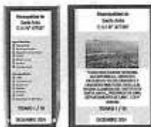
Figura N° 01