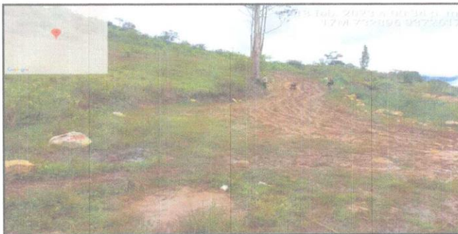
FOTO 01.- Tramo del camino vecinal en estudio en mal estado por lluvias.