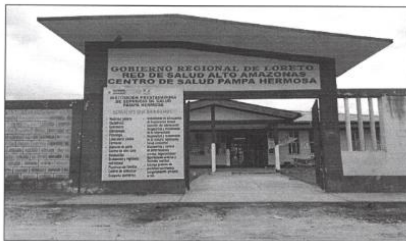
Vista 01 / Fachada principal de C-S I- 4 Pampa Hermosa – Pampa Hermosa.

Según la Ley N° 26842, Ley General de Salud, modificada por Ley N° 29889, el Estado Peruano es responsable de promover las condiciones que garanticen una adecuada cobertura de prestaciones de salud a la población en términos socialmente aceptables de seguridad, oportunidad y calidad.