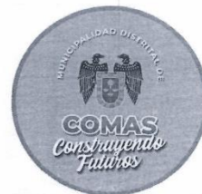
Logo de la Entidad