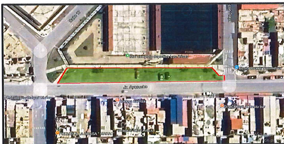
Figura 01. Ubicación del Servicio