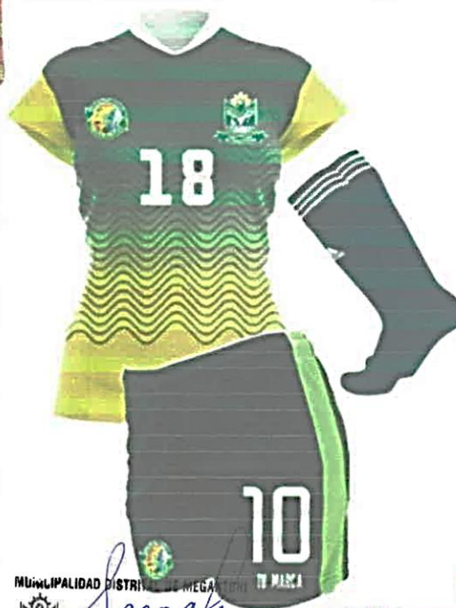
Conjunto para Mujeres