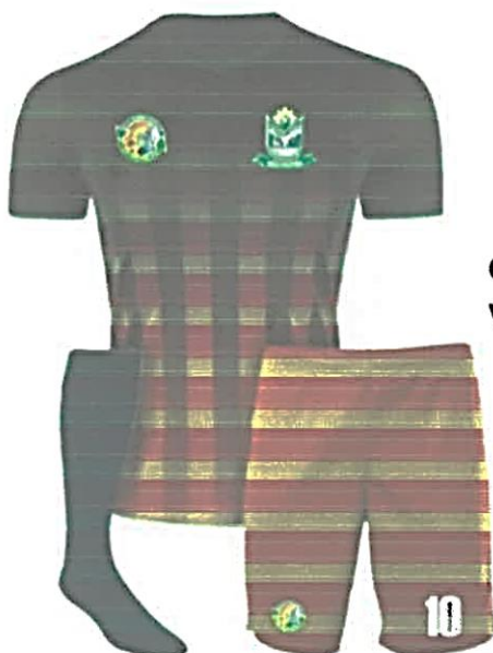
Conjunto para Varones

“Año del Bicentenario, de la consolidación de nuestra Independencia, y de la conmemoración de las heroicas batallas de Junín y Ayacucho”.