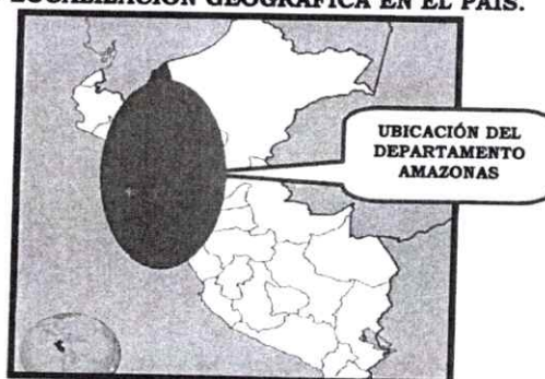
GRAFICO N° 02 LOCALIZACIÓN GRÁFICA EN EL DEPARTAMENTO DE AMAZONAS