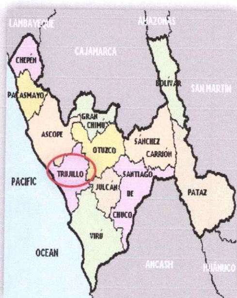
-REGION DE LA LIBERTAD - PERU