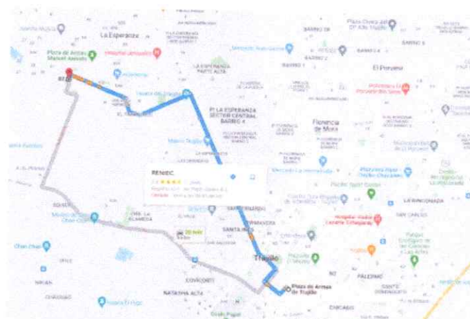
Imagen 1: Accesibilidad desde el centro histórico hasta el proyecto.