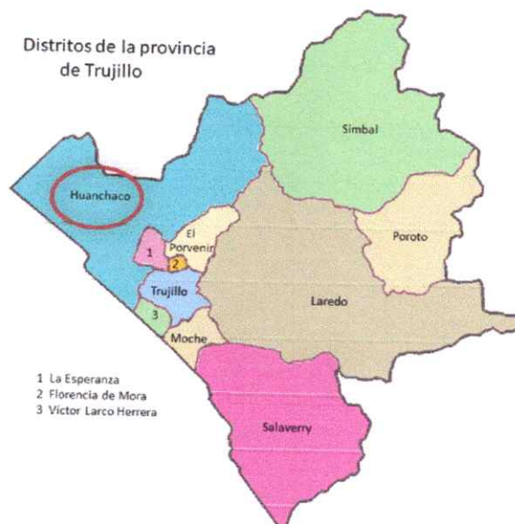
Ilustración 2. : Micro Localización del Proyecto