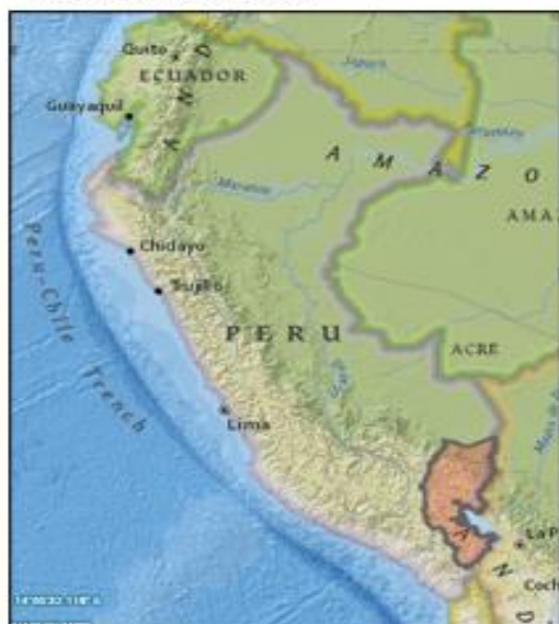
MAPA DEL PERÚ