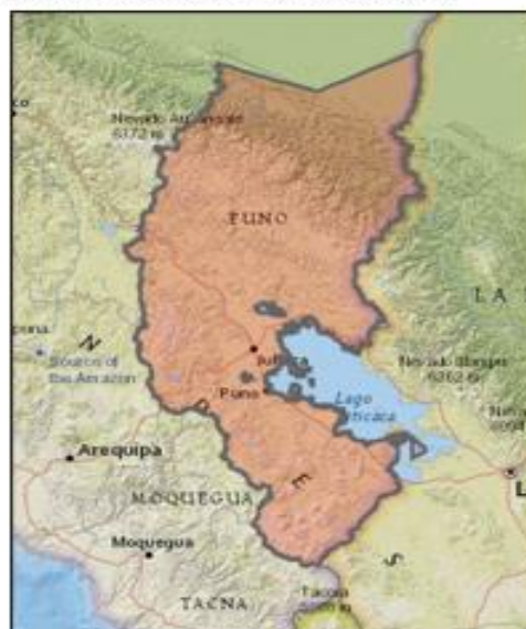
DEPARTAMENTO DE PUNO