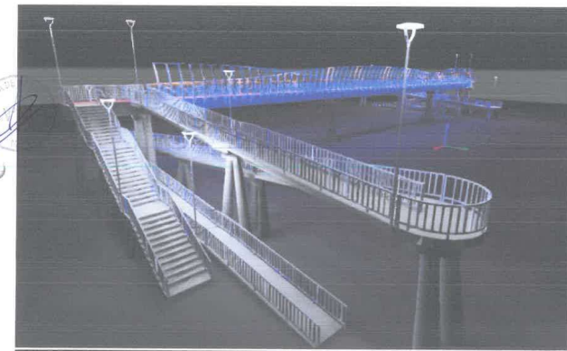
Imagen N°03.- Vista 3D del Proyecto.