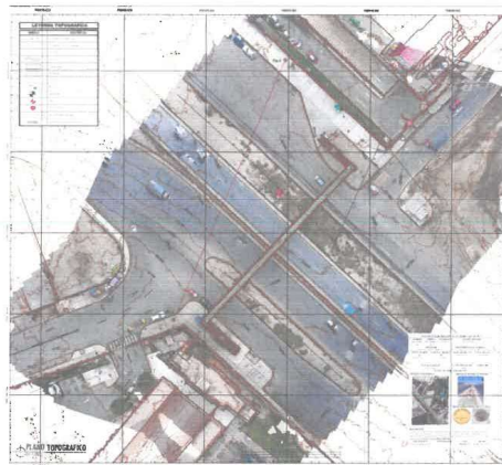
Imagen N.º 01: Vista Imagen de Aerofotogrametría – de la zona del Proyecto. (Puente el Chimbador)