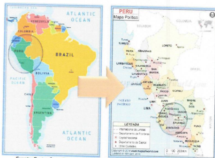
FIGURA N° 01 - MAPA DE UBICACIÓN MACRO

Provincia : Cangallo Distrito : Morochucos Región : Ayacucho