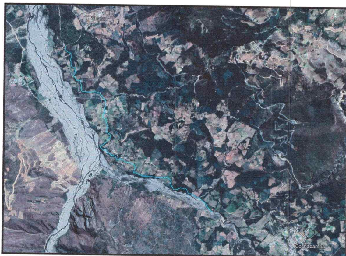
Ilustración: Imagen satelital del Canal Rio Negro del caserío de Shalar