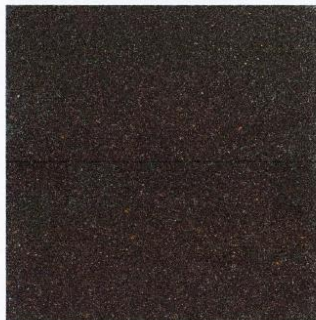
IMAGEN 02: COLOR REFERENCIAL DE MICROGRANALLA NEGRO O GRIS OSCURO.