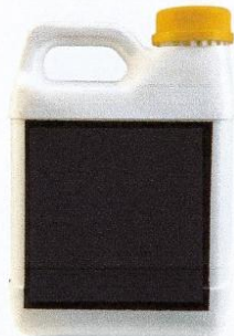
IMAGEN 04: SELLADOR IMPERMEABILIZANTE REPELENTE AL AGUA Y/O PRIMER.

NOTA: Se indica que todos los materiales deberán contar con sus fichas técnicas y deberán ser materiales vigentes, no se aceptara el empleo de materiales caducados/vencidos. Se indica que el metrado general requerido es en m 2 , el mismo considera el acabado de derrames en vanos de puertas, ventanas y muros cortina, para ello es indispensable revisar los planos de arquitectura y detalles en las láminas adjuntas (VER LÁMINAS MG-01 y MG-02), se recomienda la inspección insitu; asimismo se indica que otras actividades no consideradas en los alcances del presente documento deberán realizarse en coordinación con la residencia de obra, supervisión de obra y especialistas de obra.