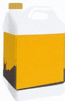
IMAGEN 01: PRIMER O PUENTE DE ADHERENCIA O EQUIVALENTE.