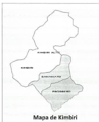
Mapa de Kimbiri