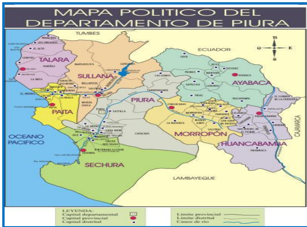
GRÁFICO N° 01 MACRO LOCALIZACIÓN DEL PROYECTO