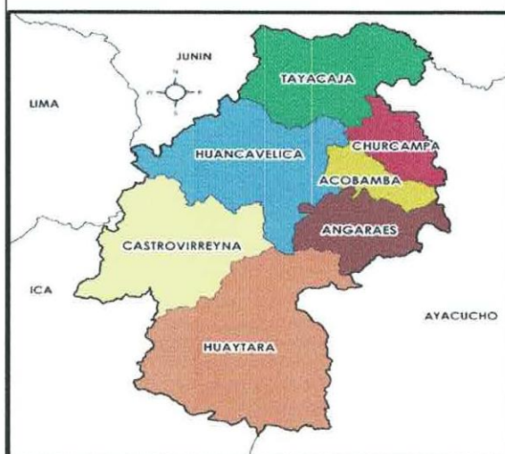
Ilustración 4: Ubicación del distrito de Huaytará