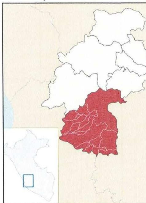
Ilustración 3: Ubicación de la Provincia de Huaytará