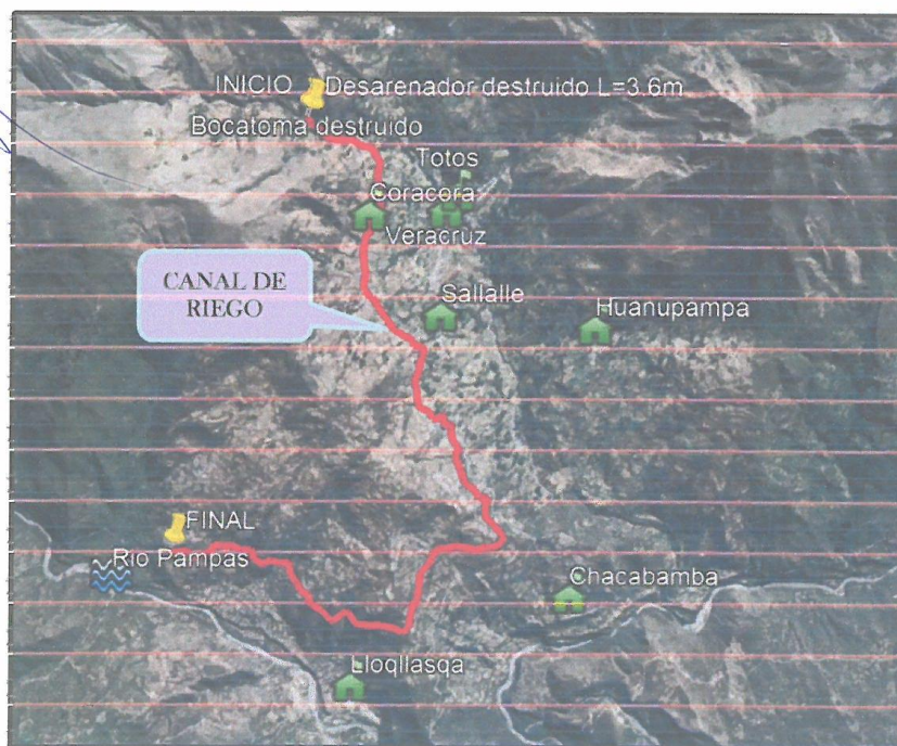
Figura 03: Imagen satelital de la ubicación del proyecto (canal de riego) – localidad de Lloqllasqa