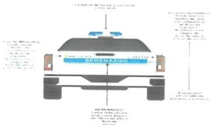
GRAFICO N° 22 - POSTERIOR

Creada el 7 de abril de 1960. Mediante Ley N° 13415