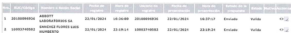
Imagen N° 01

Conforme a lo programado en el cronograma del procedimiento de selección, la presentación de ofertas (electrónica) se realizó el 22 de enero de 2024 (00:01 a 23:59 horas). Habiéndose cumplido dicho plazo, el comité de selección procedió a verificar las ofertas presentadas a través del Sistema Electrónico de Contrataciones del Estado – SEACE, figurando lo siguiente: