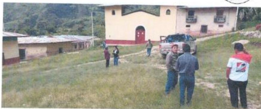
Imagen 03: Calles Que Comprenden El Proyecto

La zona del proyecto se encuentra dentro de la zona de C.P. Palco La Capilla, tiene acceso mediante el Distrito de Choropampa.