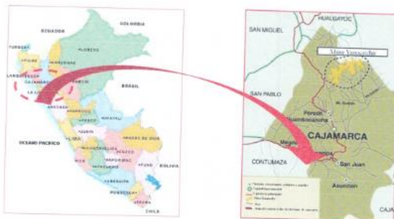
Imagen 01: Mapa de Ubicación del Proyecto

El Distrito de Choropampa, ubicada en el Departamento de Cajamarca, bajo la administración del Gobierno regional de Cajamarca, en el norte del Perú. Limita por el norte con el Distrito de Chimban; por el este con los distritos de Camporredondo y Ocalli de la provincia de Luya; por el sur con los distritos de Cortegana (Celendín) y Chadín; y por el oeste con el Distrito de Tacabamba.