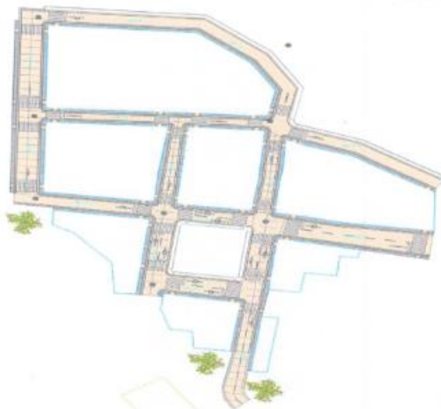
Imagen 02: Ubicación del Proyecto zona Urbana