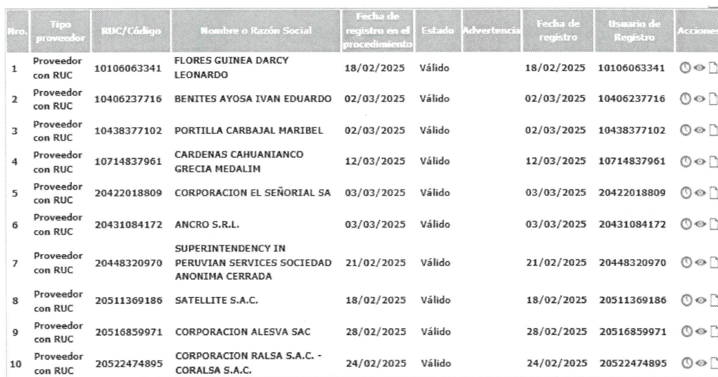
Cuadro N° 01 Detalle de los participantes validos que se registraron

En el presente acto, el Comité de Selección deja constancia que de la revisión de la plataforma SEACE, se advierte la existencia de veinticuatro (24) participantes registrados en el SEACE, de los cuales se presentó cinco (05) oferta, conforme al siguiente detalle: