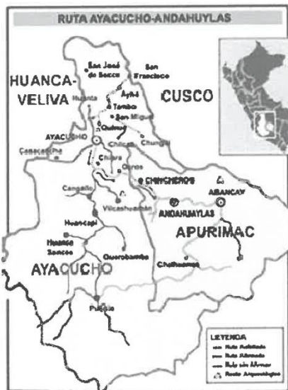
GRAFICO N° 03 RUTA VIA AYACUCHO-ANDAHUAYLAS- CUSCO