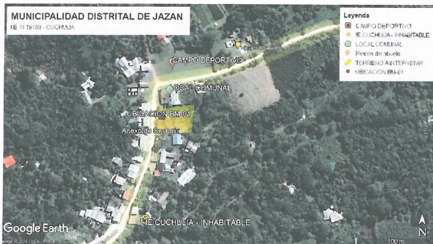
Figura N° 01: