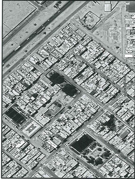
MICRO LOCALIZACION (DISTRITO DE NUEVO CHIMBOTE – PARQUE 'LA ALAMEDA' DE LAS BRISAS SECTOR 2/VILLA MARIA SECTOR)

En la actualidad el A.H. Las Brisas, NO cuenta con infraestructura en su área destinada para recreación pública, encontrándose en la zona solo terreno natural, ocasionando que los pobladores no tengan un lugar acorde con las necesidades para un mejor desarrollo de actividades sociales, culturales y psicomotrices; además es inminente el incremento de la contaminación del aire con emisiones de partículas de arena, que afecta a toda la población cercana a la zona.