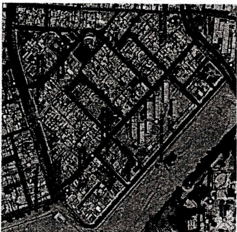
Micro Localización (Distrito Nuevo Chimbote – Urb. Las Gardenias