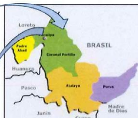
Figura 2: Mapa distrital del departamento de Ucayali