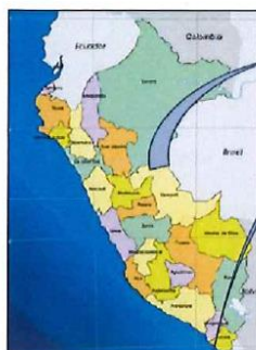
Figura 1: Mapa departamental del Perú

"MEJORAMIENTO DE VÍA A NIVEL DE AFIRMADO DE LA AV. NUEVA REQUENA (DESDE EL JR. PROGRESO HASTA LA AV. GASODUCTO) EN EL AA.HH. GUSTAVO MALDONADO ORNETA, DISTRITO DE YARINACocha CORONEL PORTILLO – UCAVALI", CUI N°2335512