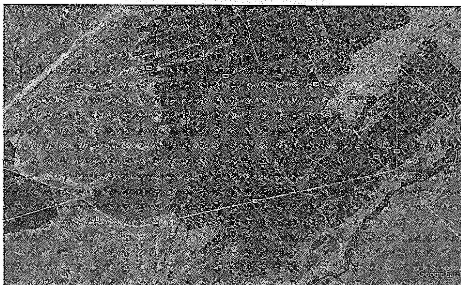
IMAGEN N° 01 UBICACIÓN DEL PROYECTO

La Municipalidad distrital de Majes ha priorizado la elaboración del estudio de pre inversión del proyecto en mención.